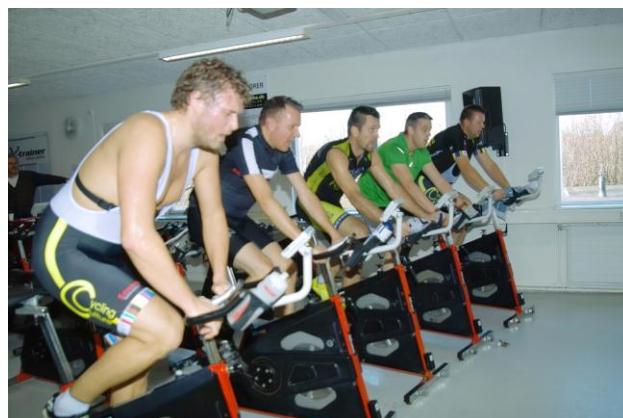
Der er 43 cykler i X-trainer studio

X-trainer Cup køres på indendørs cykler, hvor man kan se data som hastighed, distance og puls, disse data vises på egen cykel computer, samt på storskærm. Alle cykler ses på storskærmen hvor placering, distance, og afstand til nærmeste rytter kan ses, efter løbet udskrives resultatliste, med gennemsnit watt og mellemtider.